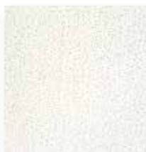
Design I Akustik \alpha_w = \text{bis } 0,80 (Optional)