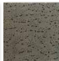
Design III \alpha_w = 0,65 (Optional)